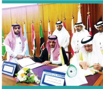
مذكرة تفاهم مع جامعة نايف العربية للعلوم الأمنية