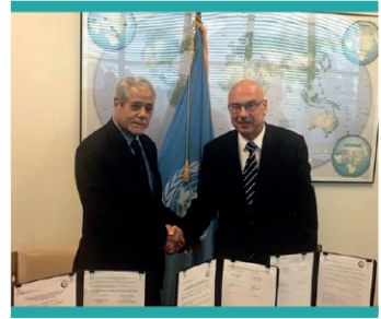
مذكرة تفاهم مع مركز الأمم المتحدة لمكافحة الإرهاب