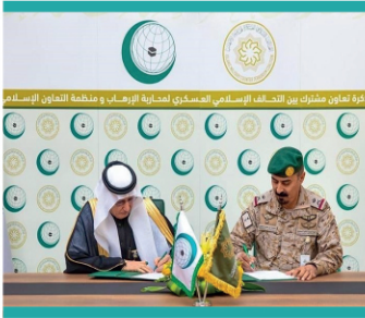
مذكرة تفاهم مع التحالف الإسلامي العسكري لمكافحة الإرهاب