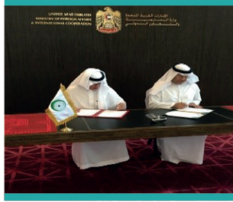
مذكرة تفاهم مع مركز صواب