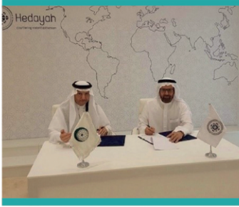
مذكرة تفاهم مع مركز هداية

يؤمن مركز صوت الحكمة بأن التصدي لظاهرة الإرهاب يتطلب جهداً دولياً متكاملًا وتنسيقاً متواصلًا مع المراكز الدولية المتخصصة في مكافحة الإرهاب على مستوى الدول الأعضاء وعلى مستوى العالم أجمع، لذا سعى المركز إلى نسج شبكة واسعة من التحالفات والاتفاقيات التي تمكنه من تنسيق العمل المشترك، وتمكنه من الاستفادة من الجهود المبذولة من طرف المراكز الأخرى المتخصصة. وتوضح الصور أسفله التحالفات والاتفاقيات التي وقعها المركز، ولايزال المركز يسعى إلى توسعة شبكة تعاونه وتحالفه مع العديد من المراكز الدولية الأخرى.