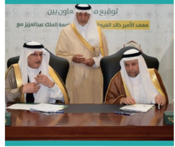
مذكرة تفاهم مع معهد الأمير خالد الفيصل للاعتدال